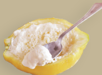
GELATO DI LIMONE RIPIENO