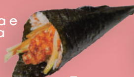
Temaki spicy tori