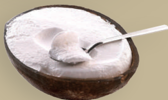
GELATO DI COCCO RIPIENO