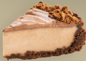
CHEESECAKE AL CARMELLO SALATO