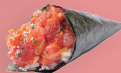
Temaki spicy shake