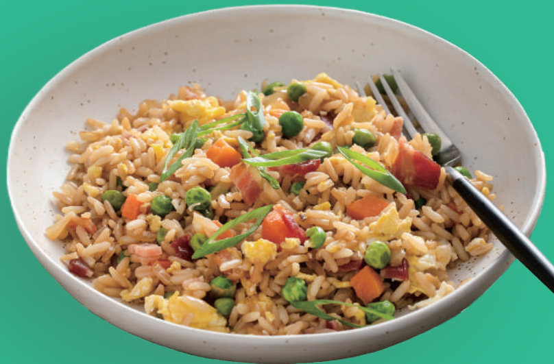
Riso Alla Cantonese

riso con prosciutto cotto, piselli, speck cinese, uova