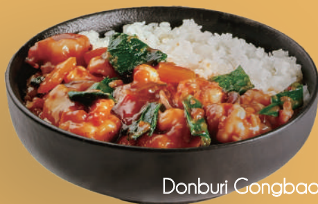
Donburi Gongbao Ebi