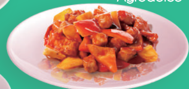
Maiale in Agrodolce