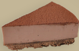
CHEESECAKE AL CIOCCOLATO