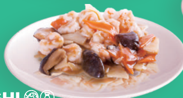
Gamberetti con Bambù e Funghi