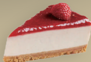
CHEESECAKE AL FRUTTI DI BOSCO