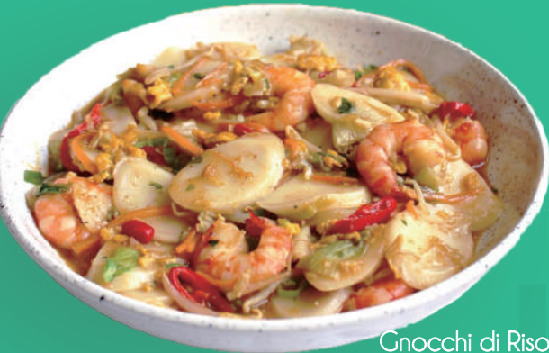
Gnocchi di Riso Kaisen