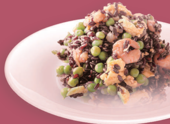
Riso Venere con Misto Mare