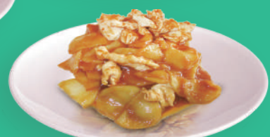
Pollo con Patate