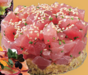
Tartare Di Tonno