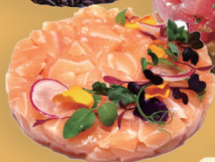
Tartare Di Salmone