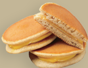
DORAYAKI FAGIOLO ROSSO

GELATO FRITTO CREMA CIOCCOLATO NOCCIOLA FLUTÈ LIMONCELLO COPPA FLUMANGO